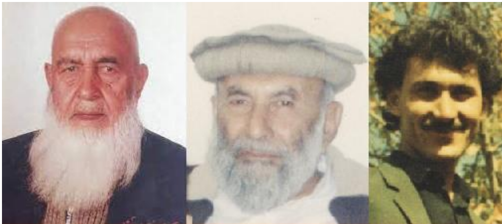
زه زما پلار او بختانی صاحب

بيا مي پلار بختاني صاحب ته وليږلم، هغه په ننگرهار مجله کې مقرر کړم (۱۳۵۹). د ننگرهار مجلې دفتر د دولتي مطبعې تر څنگ په مکرويانو کې وو.