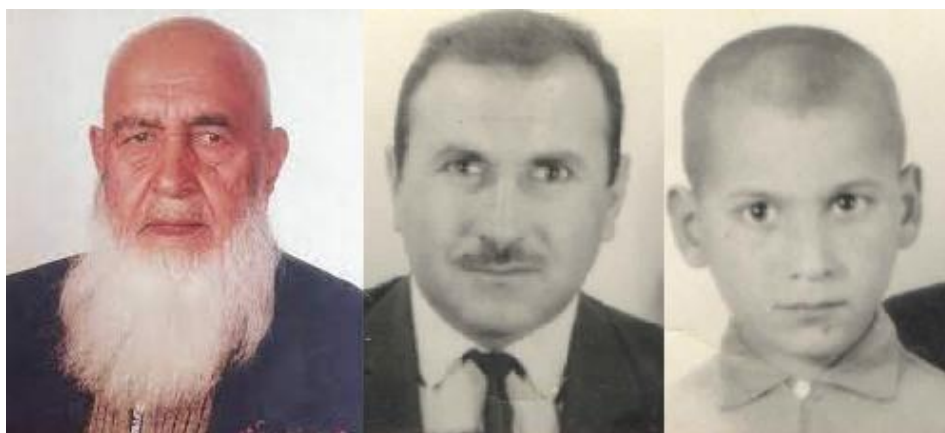
زه زما پلار او بختانی صاحب