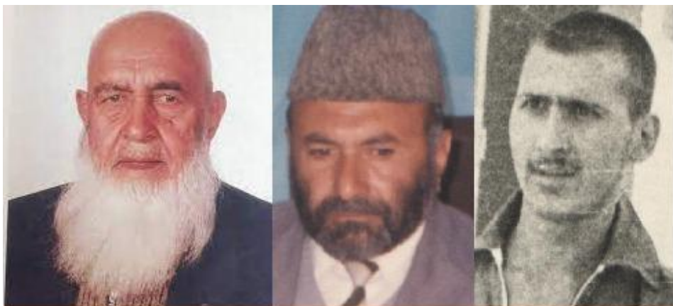
زه زما پلار او بختاني صاحب

يادونه: زما عکس د حبيبي د لېسې د وخت دی، د پلار عکس مې د تقاعد د وخت دی